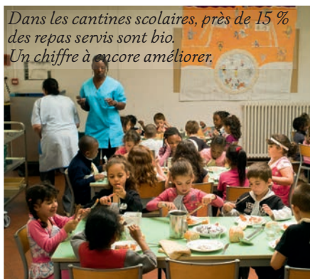
Dans les cantines scolaires, près de 15 % des repas servis sont bio. Un chiffre à encore améliorer.

(autorisé jusqu'à dix heures consécutives). Depuis le 1 er janvier, on ne parle plus de ticket horodateur mais d'abonnements, divisés en quatre catégories : résidents, commerçants, professions libérales et personnes à mobilité réduite (PMR). Si les tarifs varient pour les résidents et les commerçants, les professions libérales et les