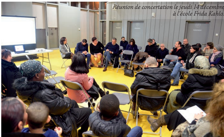
Réunion de concertation le jeudi 14 décembre à l'école Frida Kahlo.

Les échanges ont aussi porté sur l'aide de l'Etat à la Ville (750 000 euros au titre du fonds d'amorçage) qui finance une partie