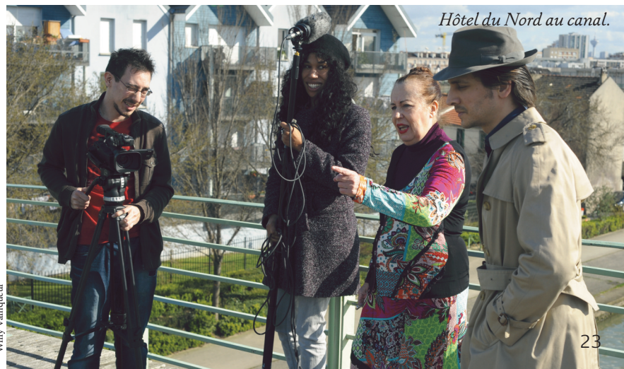
Hôtel du Nord au canal.

KUNG FU Jeudi 12 et vendredi 13 juin à 20 h • Laboratoires d'Aubervilliers 41 rue Lécuyer. Entrée libre, sur réservation reservation@leslaboratoires.org ou 01.55.56.15.90