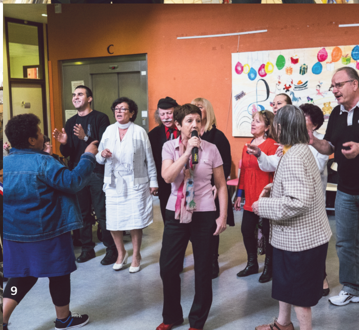
9. Portes ouvertes festives au centre gérontologique Constance Mazier avec la complicité lyrique de La Clef des arts qui a fait chanter tout le monde (samedi 24).