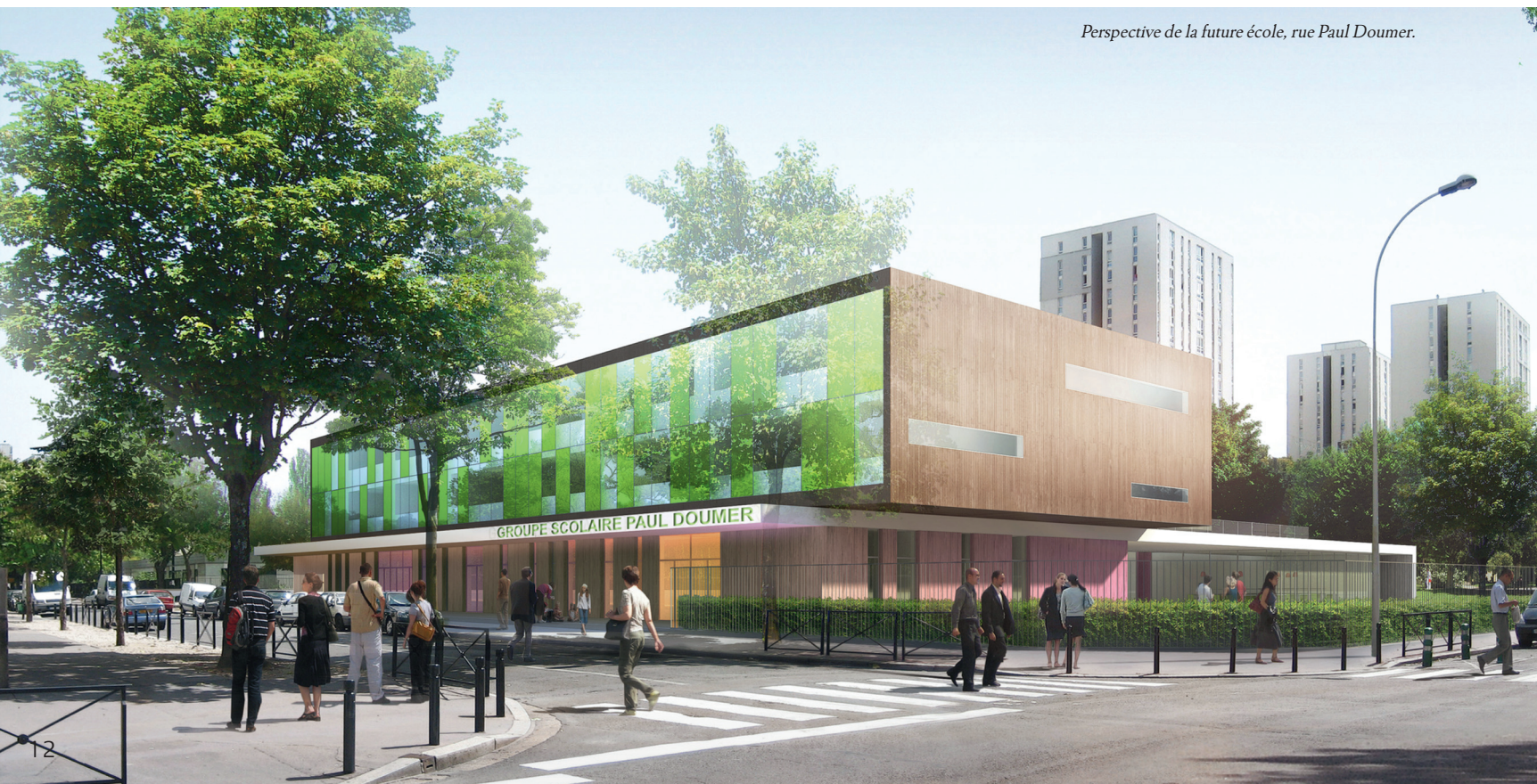
Perspective de la future école, rue Paul Doumer.